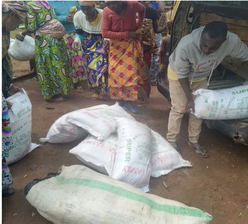
DECHARHEMENT DES VIVRES DANS LE VEHICULES