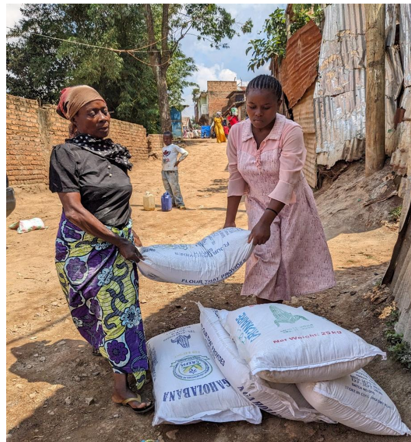
DISTRUBUTION DES VIVRES