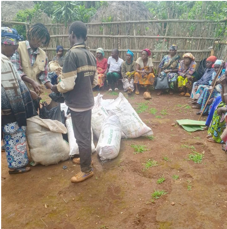
DISTRUBUTION DES PETITS POISSONS SECS