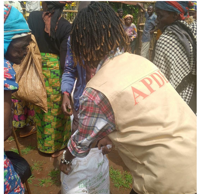
DISTRUBUTION A NYANGEZI