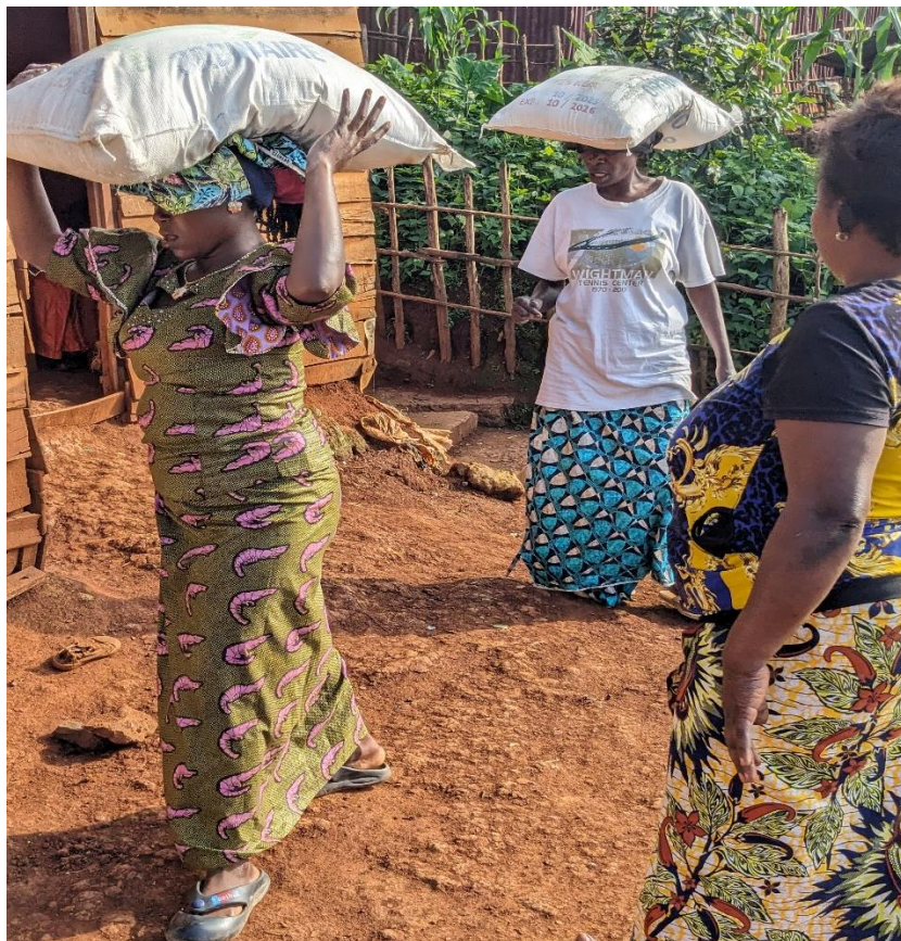
LES BENEFICIAIRES APRES DESTRUCTION DES VIVRES