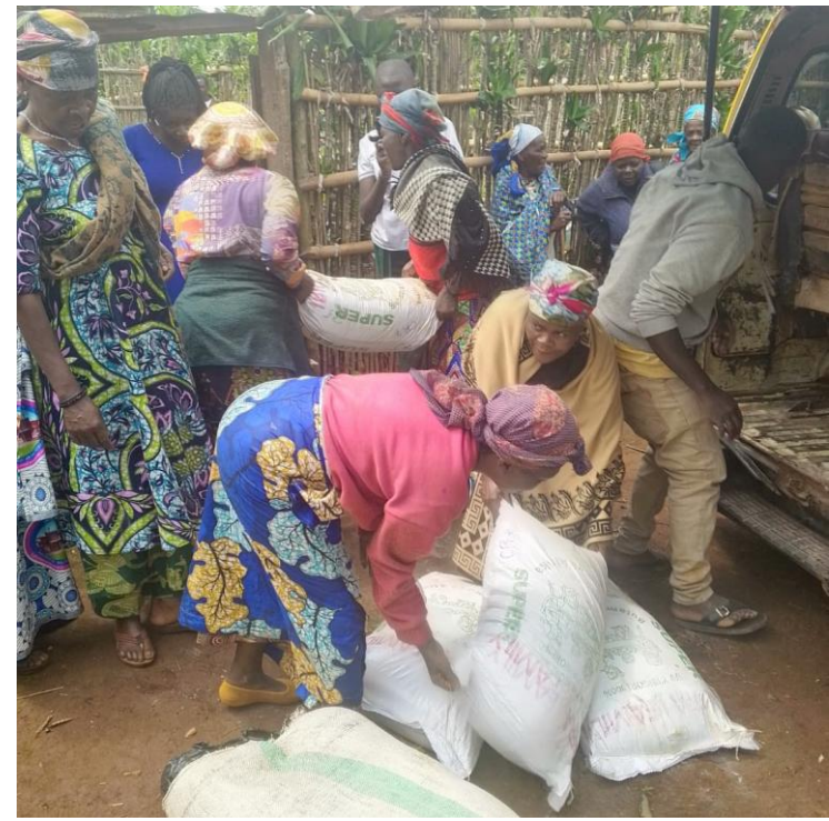
DISTRUBUTION A WALUNGU