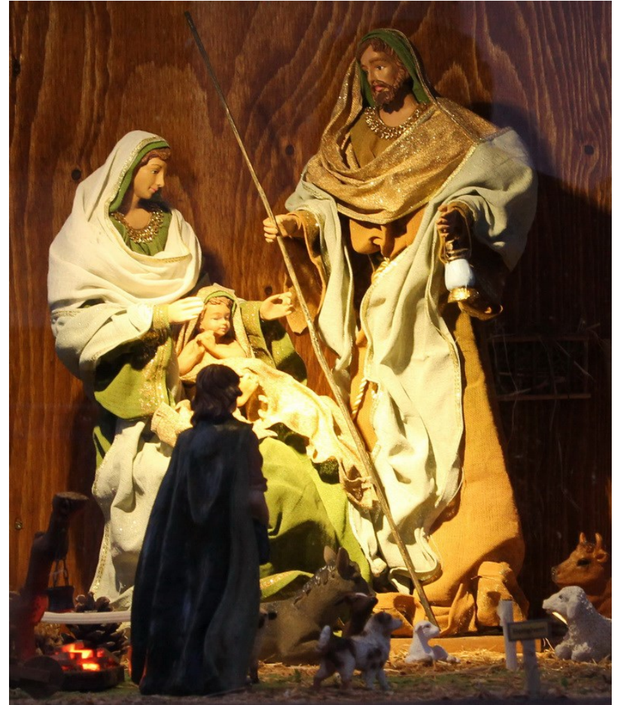
Teilansicht der Außenkrippe 2014 in Lascheid. Maria, Josef und das Jesuskind sind Leihgabe der Kirche Weweler ! Vielen Dank !

Bitte, beachten sie die Beilage auf der nächsten Doppelseite !