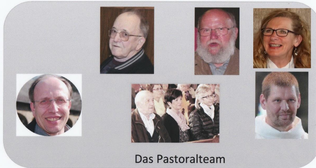
und die 5 Kontaktgruppen